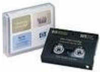
HP DDS cleaning cartridge

I supporti di memoria utilizzati per i salvataggi dei dati residenti sul Server (CARTUCCE NASTRI HP DDS cleaning cartridge), sono custoditi all'interno di cassaforte.