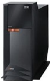
Server IBM eSERVER OPENPOWER 720

Il Software di gestione del Protocollo Informatico risiede su un'altra Unità Server IBM eSERVER OPENPOWER 720 che elabora su piattaforma LINUX.